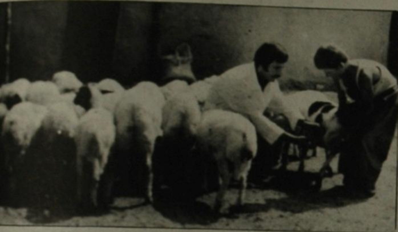
Erken kesim nedeniyle kuzu etinde verim çok düşük.